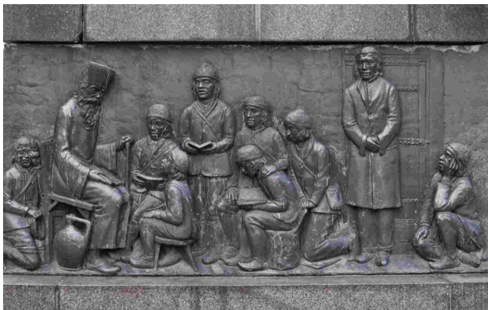
Релеф от постамента на паметника на Васил Априлов в Габрово, скулптор Кирил Тодоров