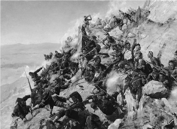
Защитата на „Орлово гнездо“, худ. Алексей Попов, 1893 г.